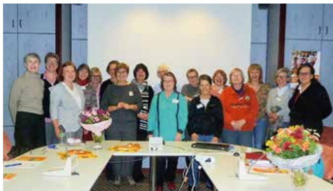
Teilnehmerinnen der 16. Tagung vom Forum 40 plus