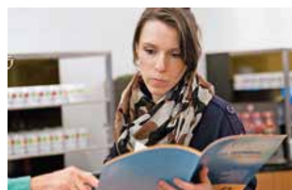
Teilnehmerin mit der DÄB-Dokumentation: „Medical Women on Top“

Vorträge, Laudationes, Auszeichnungen und Preise sowie ausgewählte Workshops unter aerztinnenbund.de/Dokumentation.0.364.1.html