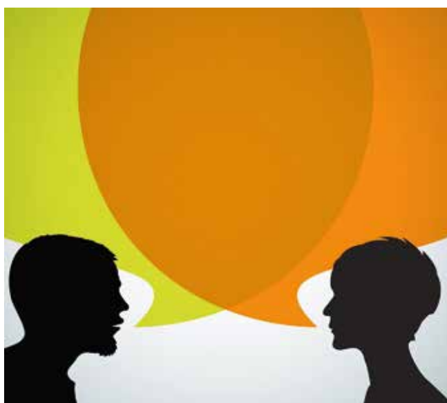
Miteinander sprechen verbindet

Die meisten Menschen haben in unserem Kulturkreis einen guten Zugang zum Internet . Sie konsultieren gern und häufig „Dr. Google“. Von Jahrzehnt zu Jahrzehnt ist der Anteil derer gestiegen, die über ihre Diagnose, Therapie und Prognose Bescheid wissen und in die medizinische Herangehensweise eingebunden werden wollen (zum Beispiel für Krebspatientinnen und -patienten liegt dies gegenwärtig bei ca. 90 bis 95 Prozent). Diese vorausgehende oder begleitende Informa-